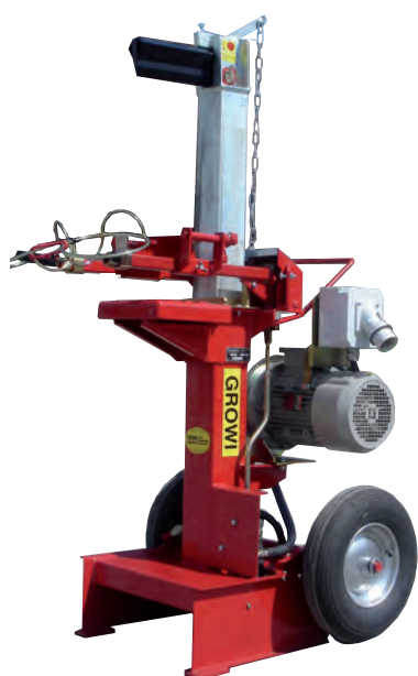
GS 7 K mit Luftbereifung