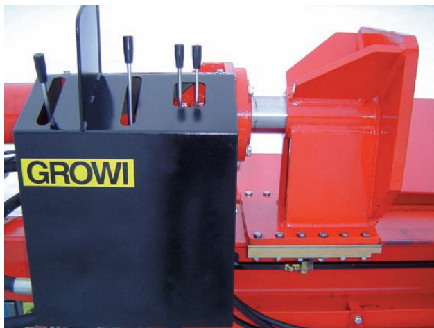
Ergonomische praxisorientierte Zweihand-Sicherheitsschaltung