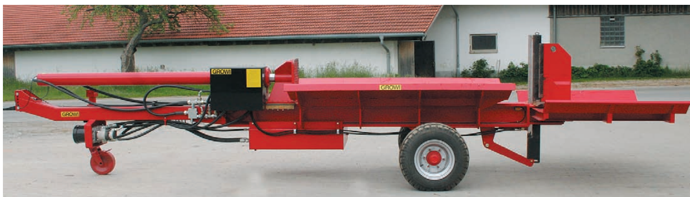
GSW 40F - 2700, lange Version mit 2,70 m Spaltlänge