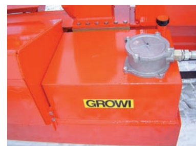
Tank mit 210 l Ölvolumen